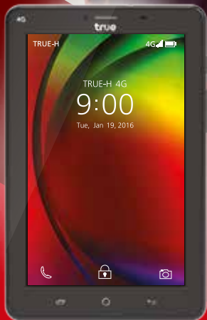
True SMART TAB 4G Speedy 7.0"