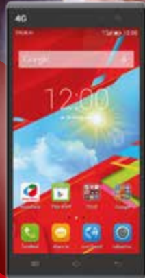
True SMART 4G Plus

รับส่วนลดมือถือ 4G สูงสุด 1,850 บาท และ รับส่วนลดค่าบริการ สูงสุด 2,400 บาท*