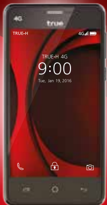
True SMART 4G Speedy 5.0"